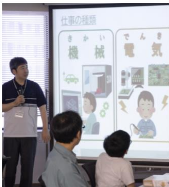
エンジニアの仕事について勉強

「ロボサク! 2023」サイト ▶ https://persol-hrpartners.co.jp/tech/lp/robo23/index.html