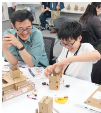
手順書を見ながらロボット工作