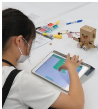
アプリでプログラミングを体験